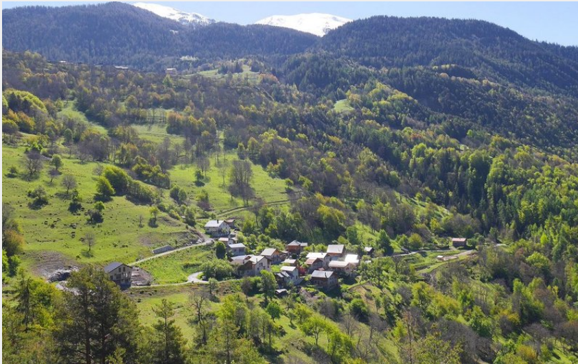
(Cœur de Tarentaise Tourisme)