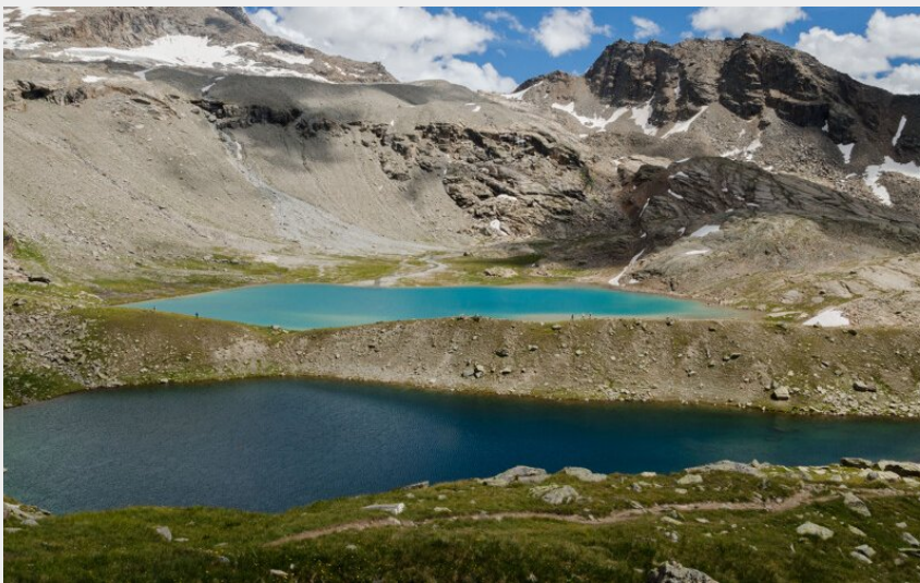
Sur le chemin du col du Carro, à la jonction du Lac Blanc et du Lac Noir (Nathalie TISSOT)