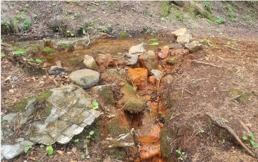
(Coeur de Tarentaise Tourisme)