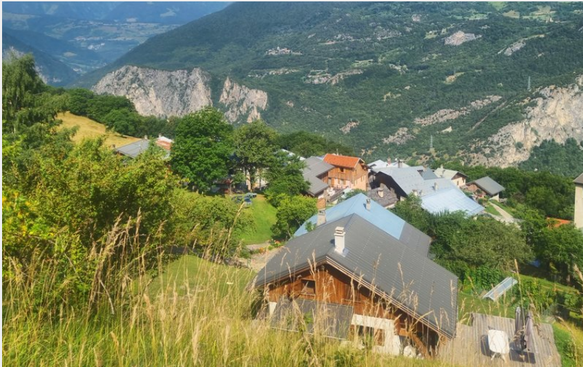
(Coeur de Tarentaise Tourisme)