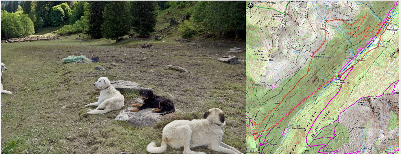
Chiens de berger (ccva)

Boucle à la journée pour découvrir la Vallée de la Grande Maison à travers ses alpages.