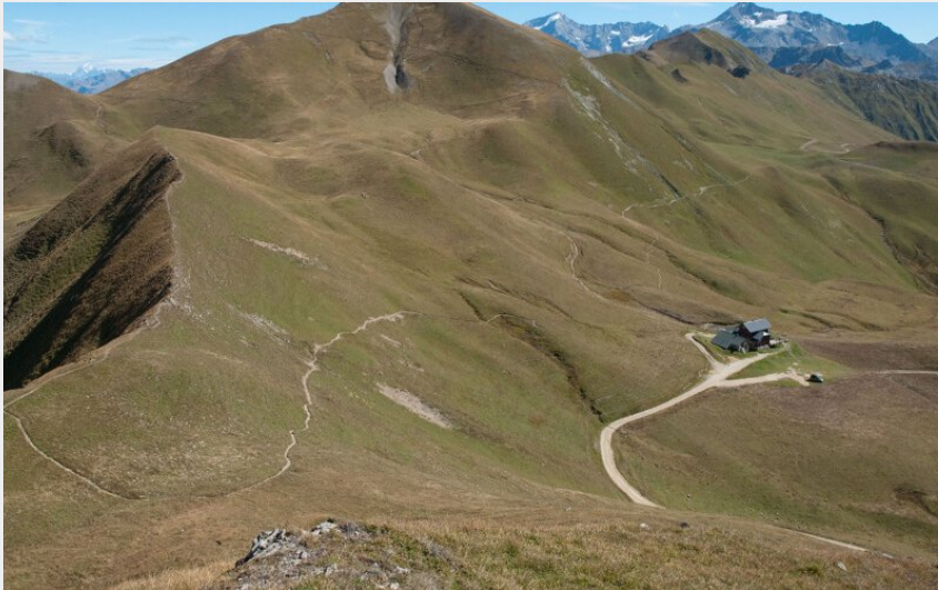
Vue sur le refuge du Mont Jovet (Christophe GOTTI)