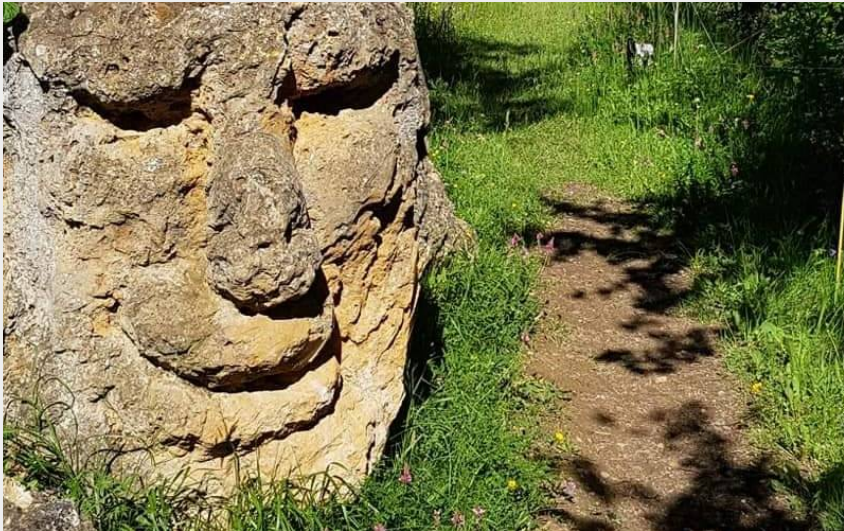
Sur le sentier artistique de Hautecour (Jean Bert)