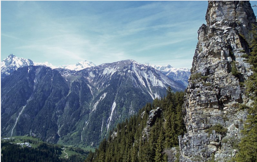
La Tour du Merle, Planay (GOTTI Christophe)