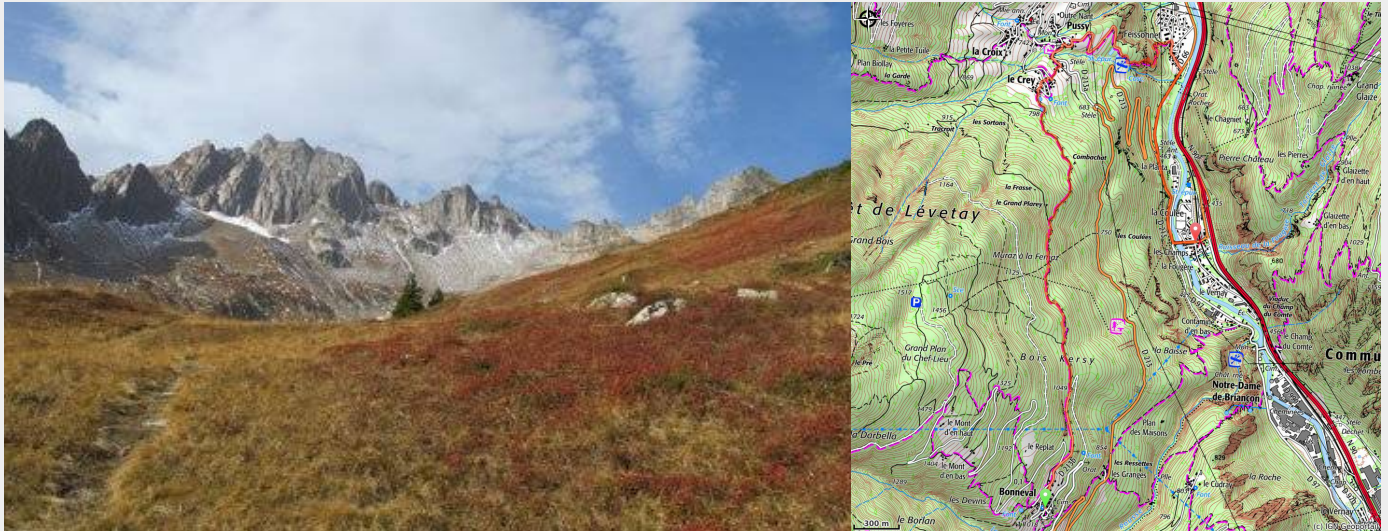
Panorama sur le massif de la Lauzière (Philippe Bargeot)