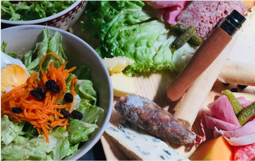
Crédit photo : à Val Cenis-Termignon, le refuge de Bellecombe (C.Jacquemoz)