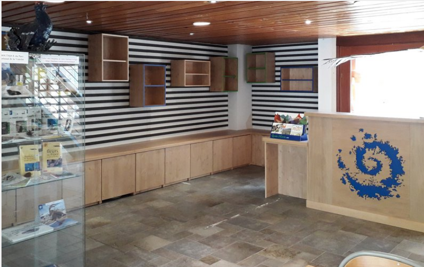
Crédit photo : Le tout nouvel espace d'accueil du Point Info Vanoise à Val Cenis Termignon.