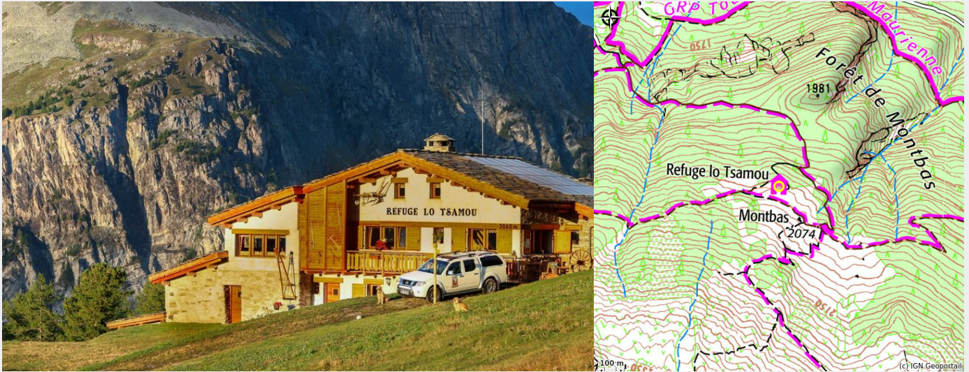
Crédit photo : Refuge Lo Tsamou à Val Cenis-Bramans (Refuge Lo Tsamou)

Bienvenue au refuge Lo Tsamou, (le Chamois en patois). Perché à 2060m, il est idéal pour une escale reposante au milieu de sa flore et faune sauvage. Splendide but de balade (1h à 1h15 de marche), et point de départ vers de nombreuses randonnées.