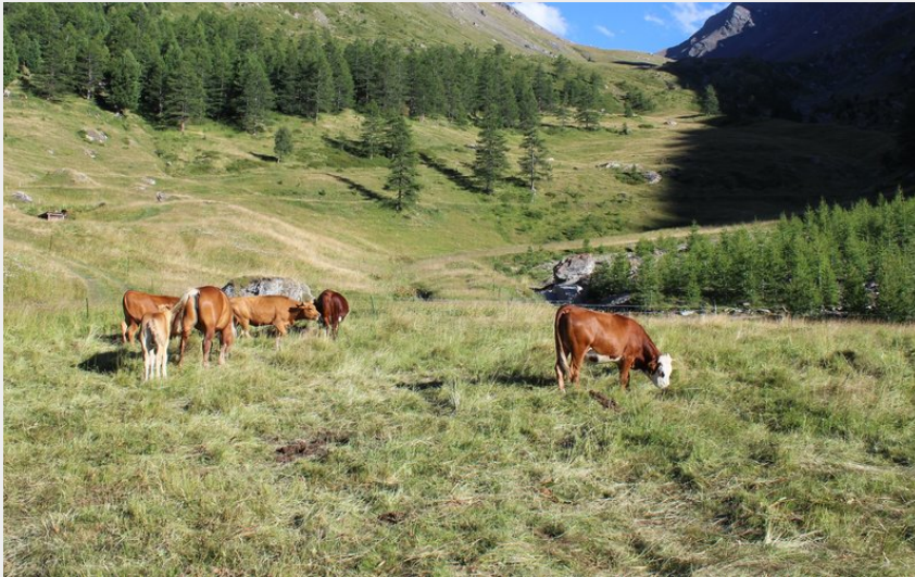
Refuge de Bramanette face à la Dent Parrachée à Val Cenis-Bramans