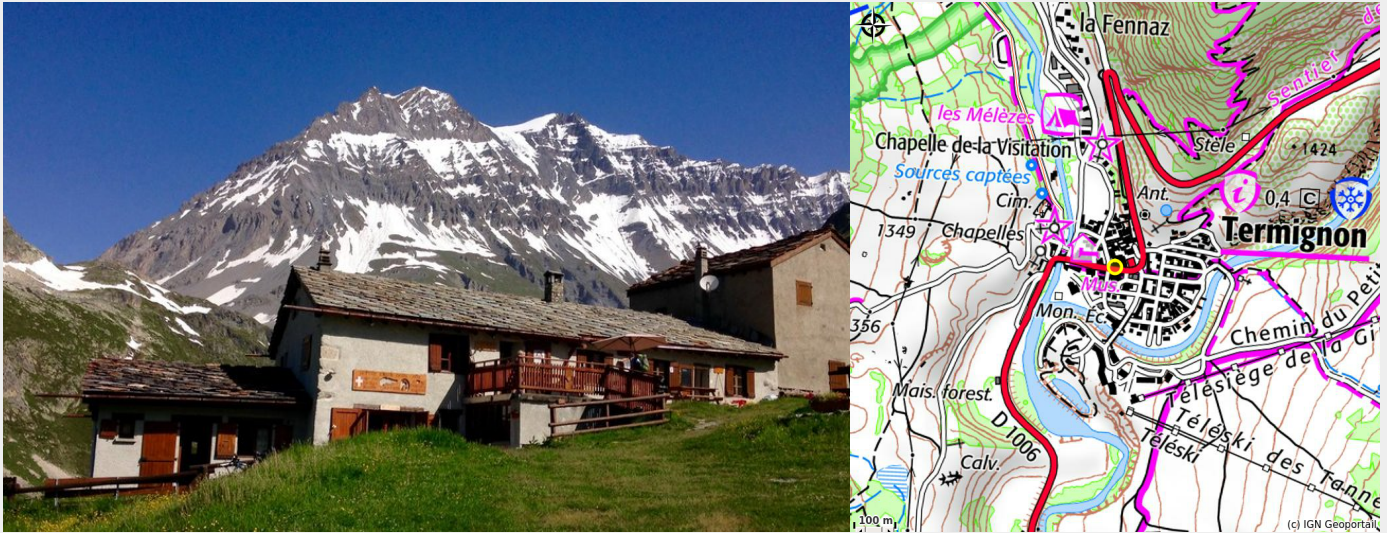
Crédit photo : Le Refuge d'Entre-Deux-Eaux à Val Cenis Termignon (sylvie.richen)

Le refuge Entre-Deux-Eaux est un lieu familial centenaire, situé au cœur du Parc National de la Vanoise. Nous vous proposons une cuisine élaborée par nos soins, privilégiant les produits locaux et bio.