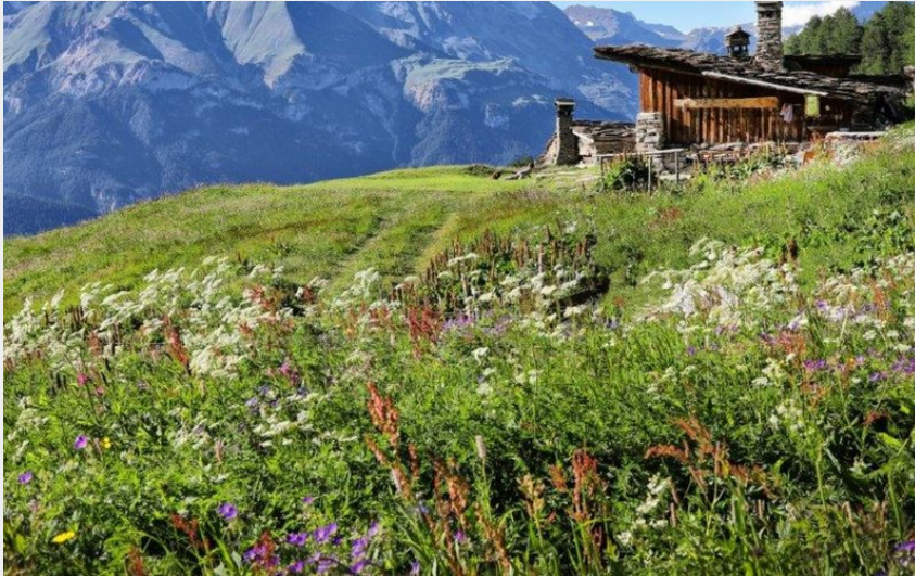
Crédit : Le refuge au milieu des alpages (Refuge de Bramanette/Studio Viard)