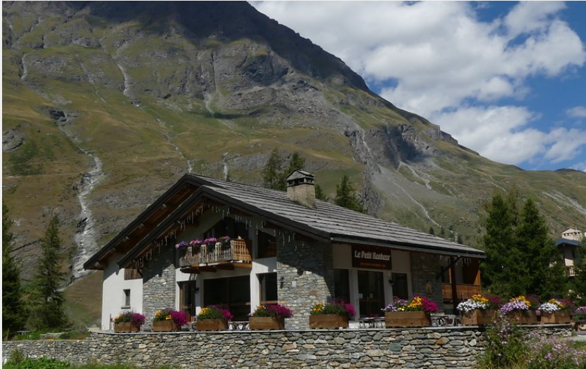
Crédit photo : Vue extérieure été du gîte d'étape le Petit Bonheur (Petit Bonheur)