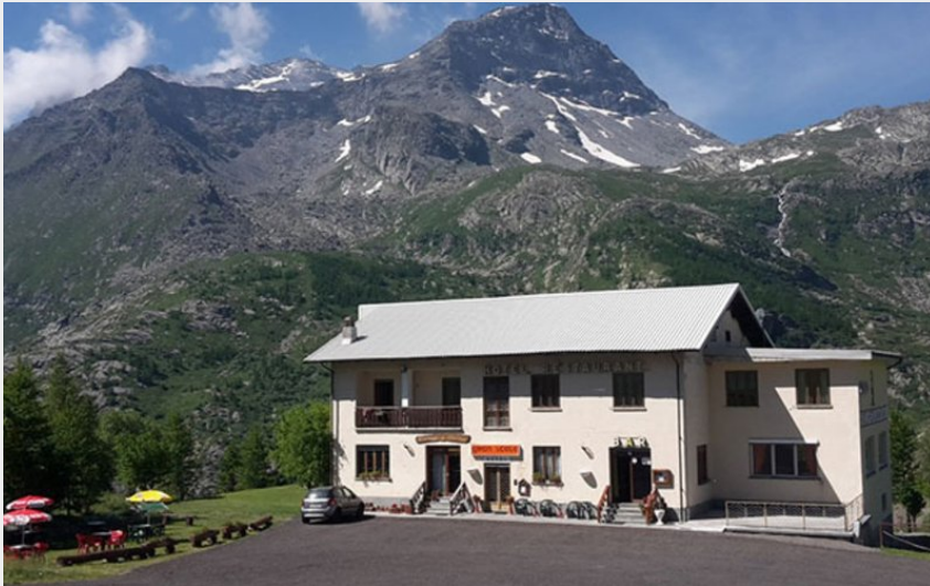
Refuge Gran Scala au pied du barrage du Mont-Cenis