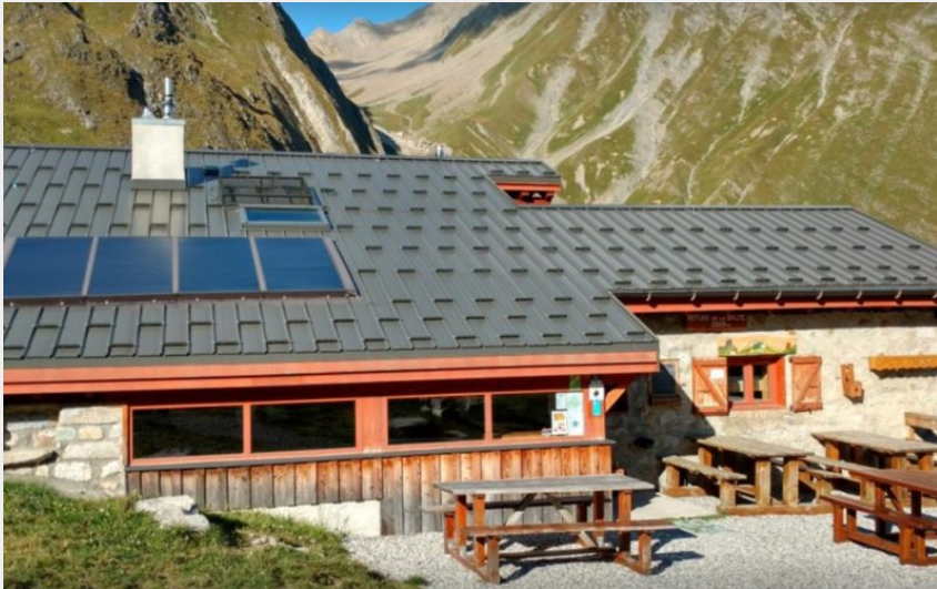
Crédit photo : Refuge de la Balme vallée de la Plagne (Eric Rebmann)