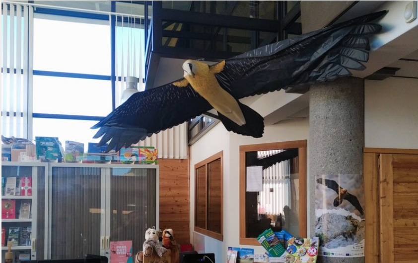
Crédit photo : Point info Parc national de la Vanoise - Aussois_Aussois (Aurélien SANREY - PNV)