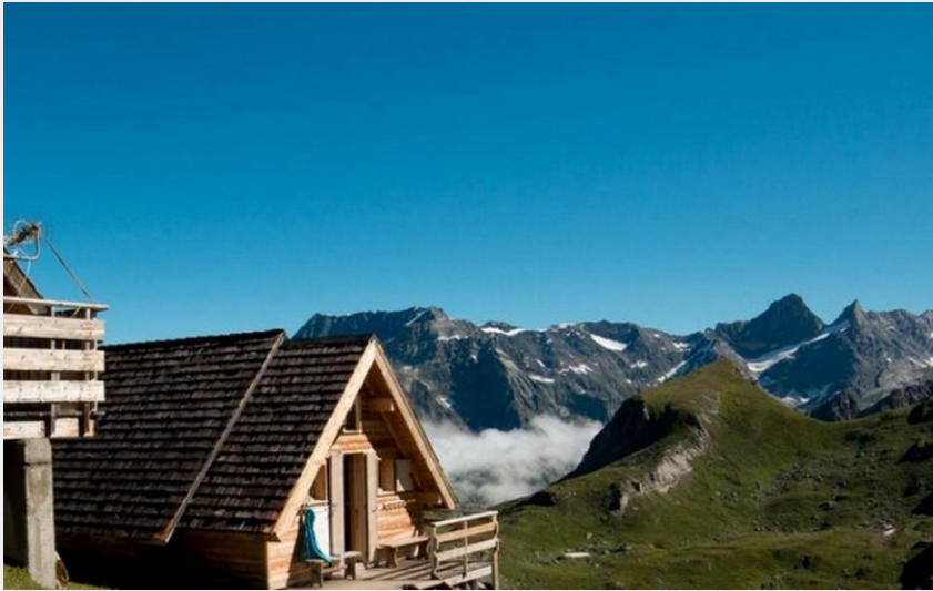
Crédit photo : La Valette en été (Parc National de la Vanoise BUCZEK Jessica)