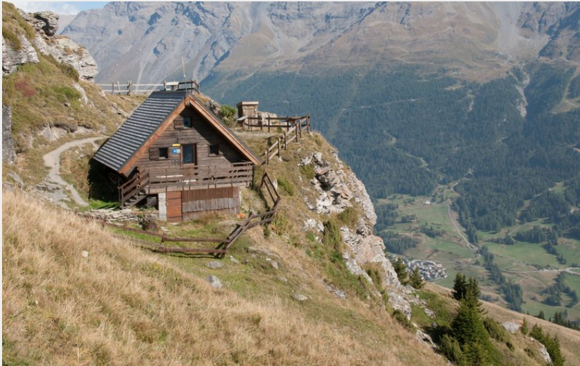
Crédit photo : Refuge de Cuchet non gardé, ouvert toute l'année (Parc national de la Vanoise)