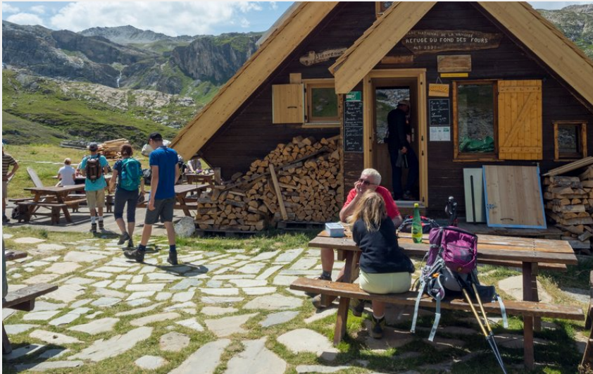
Crédit photo : Extérieur - Refuge du Fond des Fours - Val d'Isère (pnv)