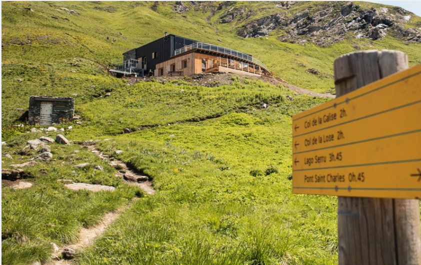
Panneau de randonnées avec le refuge de Prariond au loin en été