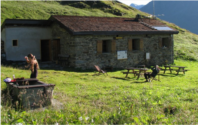
Crédit photo : Refuge appartenant au Parc national de la Vanoise (© Refuge de la Martin)