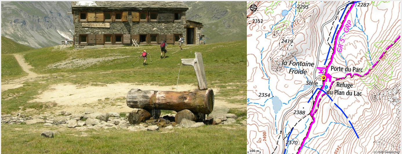
Refuge du Plan du Lac à Val Cenis-Termignon en été

Ce refuge du Parc national de la Vanoise est une étape du GR5 et de la Via Alpina. Il fait face à un panorama exceptionnel. Aux abords immédiats du refuge se trouvent des outils de découverte sur les patrimoines de Vanoise (faune, flore et paysage).