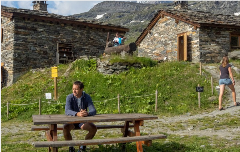
Crédit photo : Refuge de l'Arpont, refuge du Parc national de la Vanoise à Val Cenis (PNV)