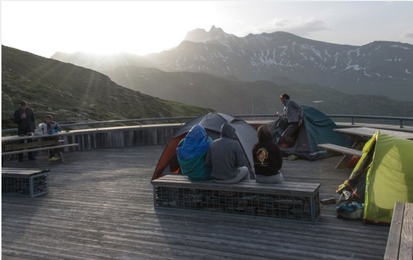
Crédit photo : Aire de bivouac au refuge de l'Arpont (Lecomte Céline - PNV)