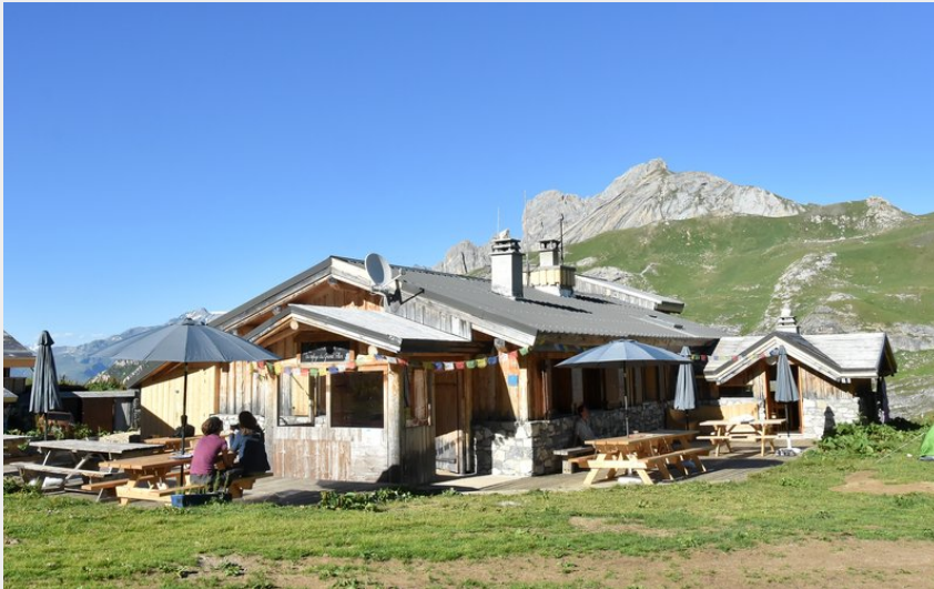
Crédit photo : Refuge du Grand Plan (Laurent Bois_Mariage, Laurent Bois_Mariage )